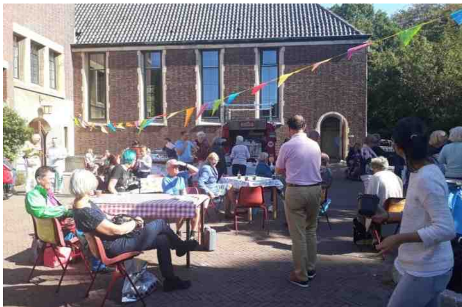
Open monumentendag in de Duinzichtkerk, 14 september

(recente preken over I en II Samuel zijn na te lezen op www.ctkerk.nl/preken )