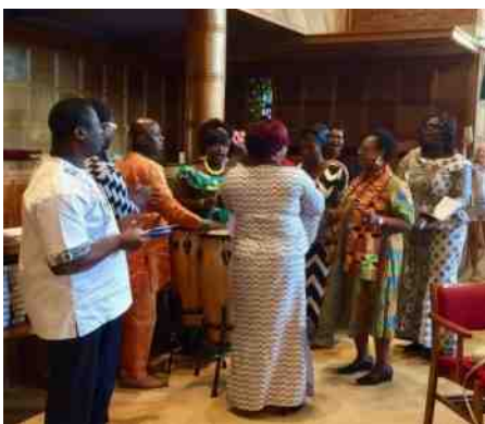
Foto voorpagina: Ghanese gemeenteleden op Startzondag, 15 september

Wilt u informatie op de website laten plaatsen, neem dan contact op met het Kerkelijk Bureau, duinvre@xs4all.nl .