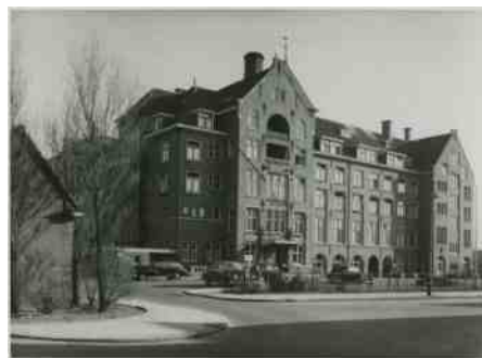
Situatie in 1948 aan Bronovolaan

Bronovo. Vanaf 12 september 1929 ging het er komen, het derde ge- bouw. De 'eerste steen' door konin- gin-moeder Emma gelegd. Op 4 fe- bruari 1932 was het zover: de diaco- nesseninrichting is klaar. Al het per- soneel is verhuisd. Vanuit de Laan van Meerdervoort: 'Naar het nieuwe Huis' zoals het gedenkboekje heet. Prinses Juliana kwam het openen. In het Benoordenhout. Wel ver, vond men. Eromheen kwamen vele