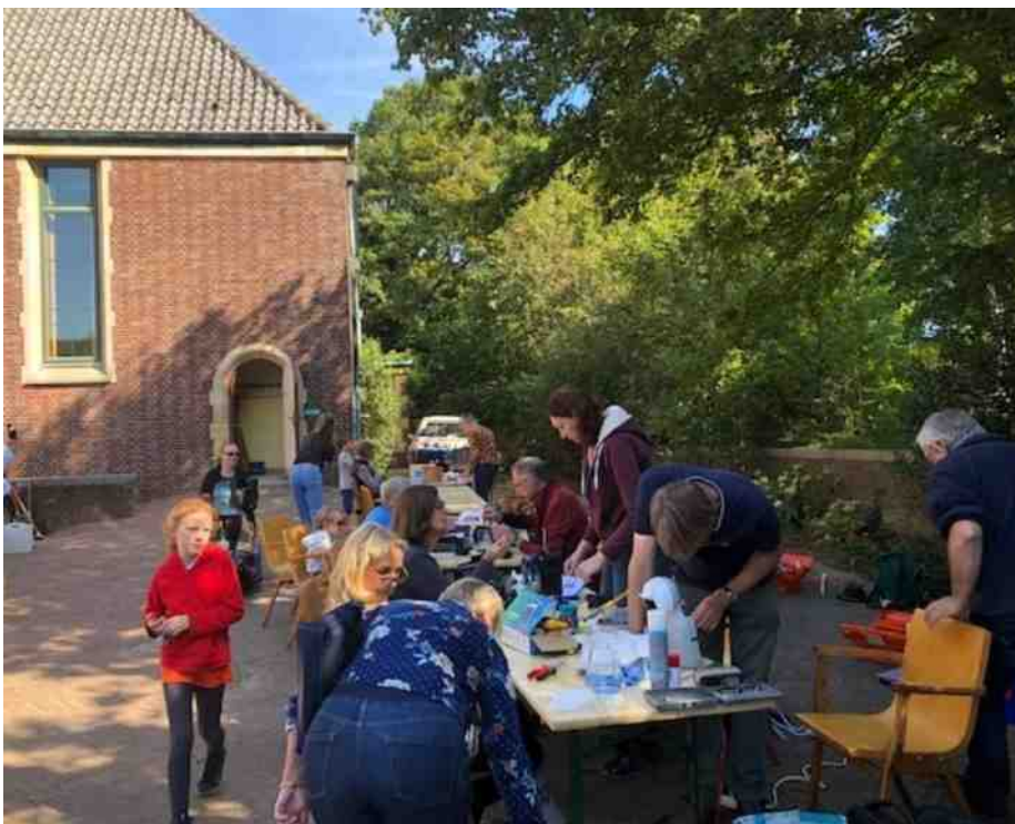
Repair Café op Open Monumentendag