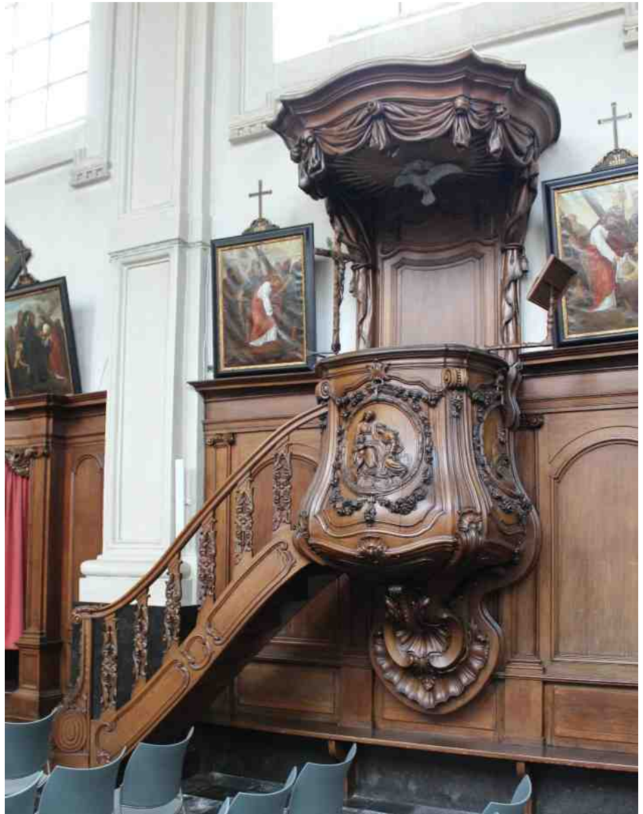
Preekstoel van St. Catharinakerk te Wondelgem