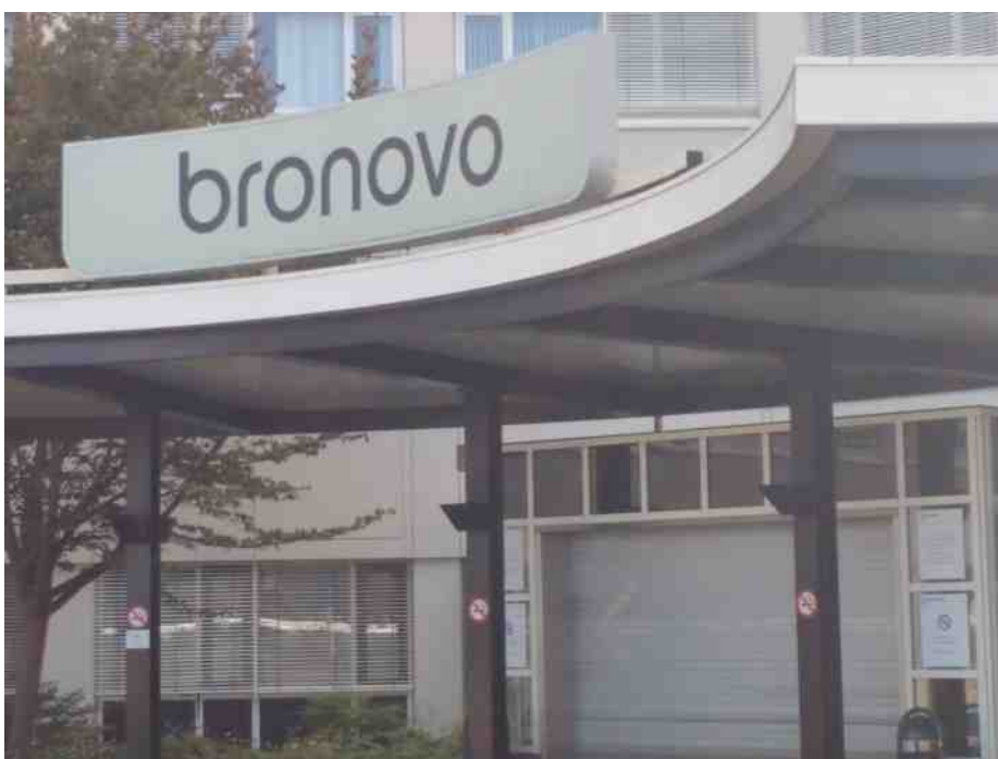
De dichte draaideur, het gesloten rolgordijn.