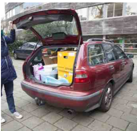
BabyBullenBank STEK, Parkstraat 32, Den Haag