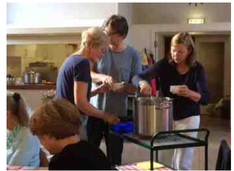
Maaltijdgroep maandag 2 september, foto's Ada Bosman

Het was een hele gezellige en smakelijke avond, de dominees zullen jaloers zijn als ze zien hoe druk en gezellig zo'n maaltijdavond in de kerk is. Hierbij nodig ik hen graag uit om eens mee te komen eten. Schrijf in de agenda, maandag 7 oktober is er weer een maaltijd, hopelijk MET koffie!