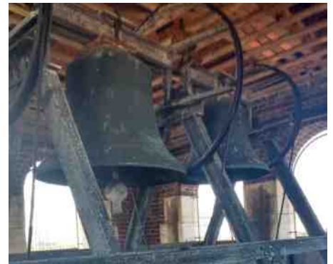
Twee van de drie klokken van de Duinzichtkerk.

Wilt u meelopen met de mars? Sluit u dan aan bij de groep Groene Kerken. Precieze informatie over de verzamelplaats vindt u de dagen voorafgaand op www.groenekerken.nl .