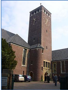
Afb. 5 Duinzichtkerk, beide torens (foto:

https://upload.wikimedia.org/wikipedia/commons/thumb/3/32/Duinzichtkerk.JPG/266px-Duinzichtkerk.JPG , laatst geraadpleegd op 29 januari 2018).