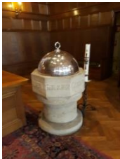
Afb. 10 Doopvont Duinzichtkerk (28 januari 2018).

Omdat in de protestantse kerk tijdens het interbellum het Woord nog centraal stond, was het koor in de Duinzichtkerk bijzonder. De eikenhouten avondmaalstafel (afb. 9) heeft de vorm van een altaar, wat wel kritiek heeft opgeleverd. 33 De twee zilveren kandelaars en de zilveren bloemenvaas op de tafel zijn geschonken, evenals het zilveren avondmaalsstel, versierd met korenaren en druiventrossen als symbool van brood en wijn. Het stenen doopvont met zilveren deksel (afb. 10) is anglicaans geïnspireerd. Bronnen vermelden zowel Ely als Exeter cathedral. 34