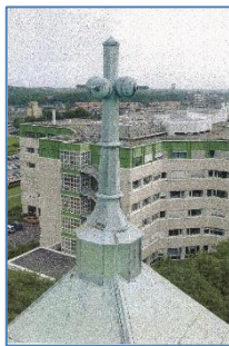
Afb. 7 Oude opbouw van de toren.

Naast de ingang onder de toren bevindt zich de eerste steen (afb. 6), die gezien kan worden als de bron van het liturgische gedachtegoed. De bijbeltekst 'Die van boven komt is boven allen' (Joh. 3:31a) verwijst naar Christus als fundament van deze christocentrische kerk. 28