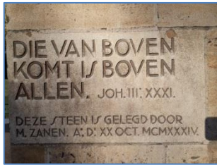
Afb. 6 Eerste steen als bron van identiteit.

Naast de ingang onder de toren bevindt zich de eerste steen (afb. 6), die gezien kan worden als de bron van het liturgische gedachtegoed. De bijbeltekst 'Die van boven komt is boven allen' (Joh. 3:31a) verwijst naar Christus als fundament van deze christocentrische kerk. 28