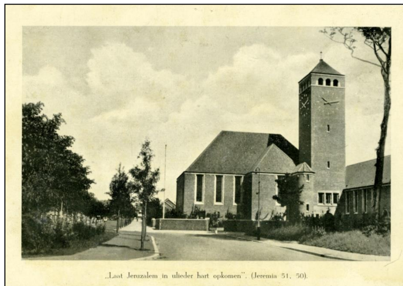
Afb. 1 Verschoor, Willem, Duinzichtkerk, 1935.

Onderzoek naar de identiteit van de Haagse Duinzichtkerk in het interbellum