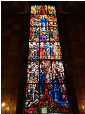
Afb. 3 Gebrandschilderd raam 'De roeping van de discipelen', 1935.

In het interieur is de kruisvorm duidelijker herkenbaar dan aan de buitenkant. De wanden zijn deels van baksteen en deels betimmerd met eikenhout dat verdeeld is in vierkante vakken. De kap is afgesloten en het platte renaissanceplafond is bedekt met blauwe dempoplaten tussen zware en lichte eikenhouten balken.