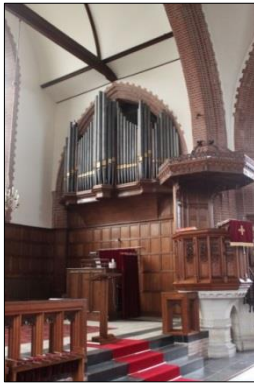
Afb. 4 De Nieuwe Kerk IJmuiden.

geïnspireerd door de anglicaanse kerk, zijn liturgische ideeën over liturgie en kerkbouw in praktijk in de Nieuwe Kerk te IJmuiden (afb. 4) en in de identieke Duinoordkerk te Den Haag. 19