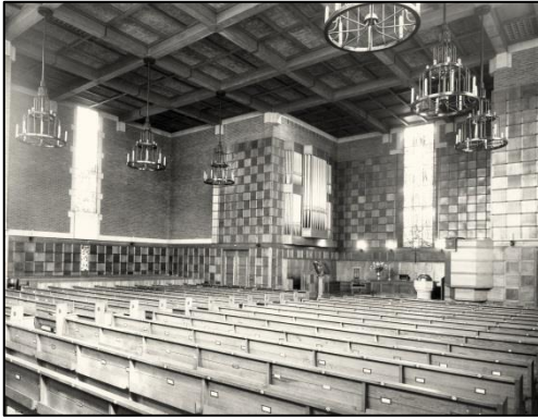
Afb. 8 Interieur Duinzichtkerk.