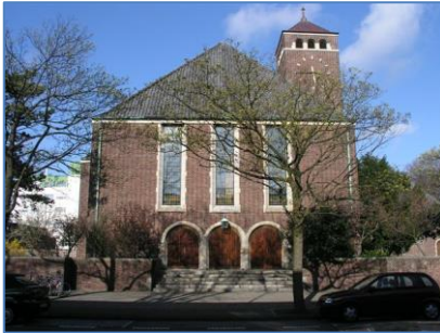
Afb. 2 Duinzichtkerk heden, hoofdingang.

vormt met de daken van de aangrenzende gebouwen. 5 Centraal in het complex bevindt zich de robuuste, 32 meter hoge vierkante toren met aan elke zijde drie rondboogvormige galmgaten voor de drie luidklokken en een koperen wijzerplaat. De toren wordt bekroond door een piramidevormig dak met 'een modern verguld kruis'. 6